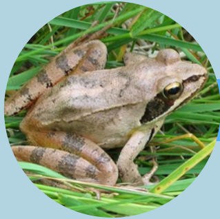
La grenouille agile