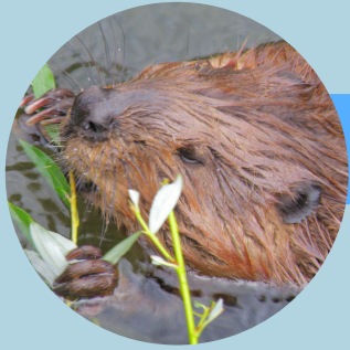
Le castor d'Europe