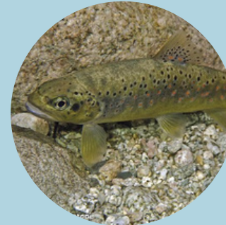
La truite Fario