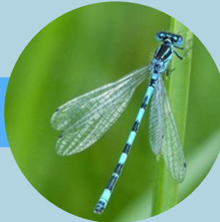
L'agrion de mercure