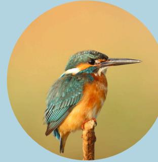
Le martin pêcheur