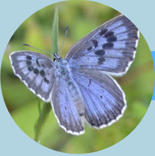
L'azurée du Serpolet