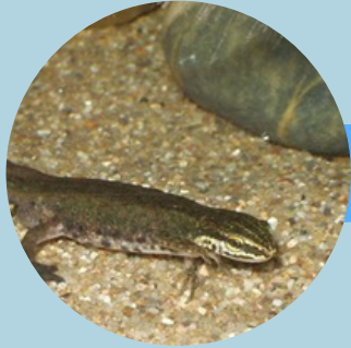
Le triton palmé