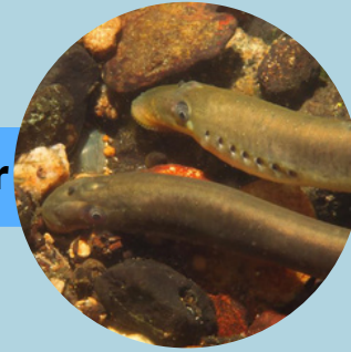
La lamproie de Planer