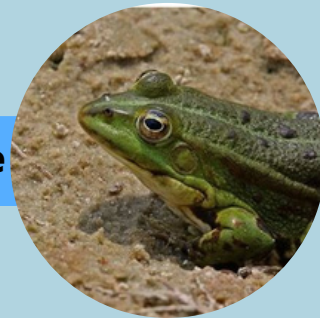
La grenouille rieuse